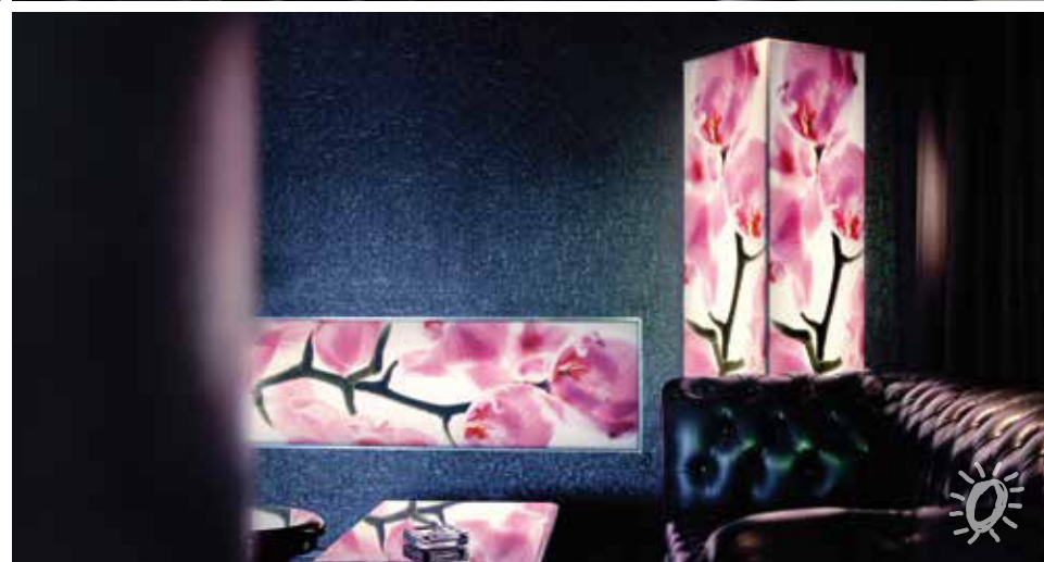
Systemecke | System corner